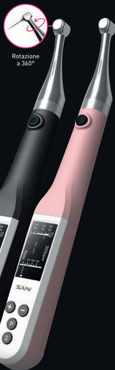
Rotazione a 360°