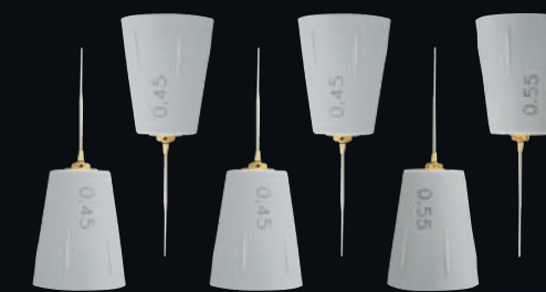
Puntali per guttaperca